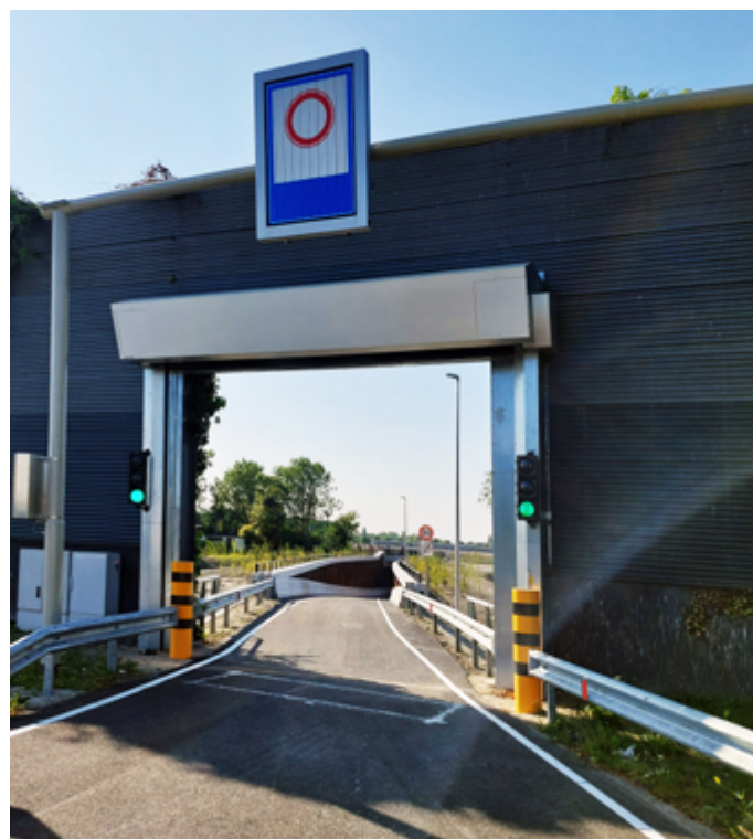
De onderdoorgang van de Hornweg, genomen vanaf de OLV uitgang op de N201. Omwonenden hebben meegedacht over beplanting van talud en het hekwerk van de onderdoorgang bij de Hornweg.

De werkzaamheden aan de Middenweg duren naar verwachting tot eind 2024 (zie ook pagina 6). •