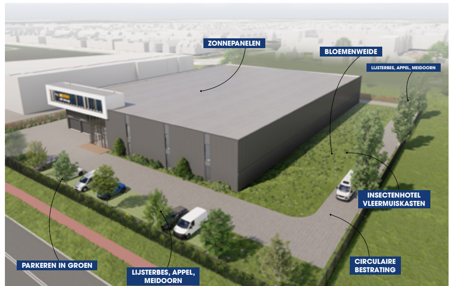
Impressie van het gebouw Mijn Safestore in Aalsmeer.

De realisatie van het gebouw is nu in volle gang met het uitvoeren van de heiwerkzaamheden. Dit duurt tot eind juni 2023. De bouwwerkzaamheden voor het gehele gebouw duren naar verwachting tot februari 2024. Vanaf dat moment is het mogelijk voor inwoners en ondernemers uit de omgeving om gebruik te maken van de opslagruimte van Safestore. •