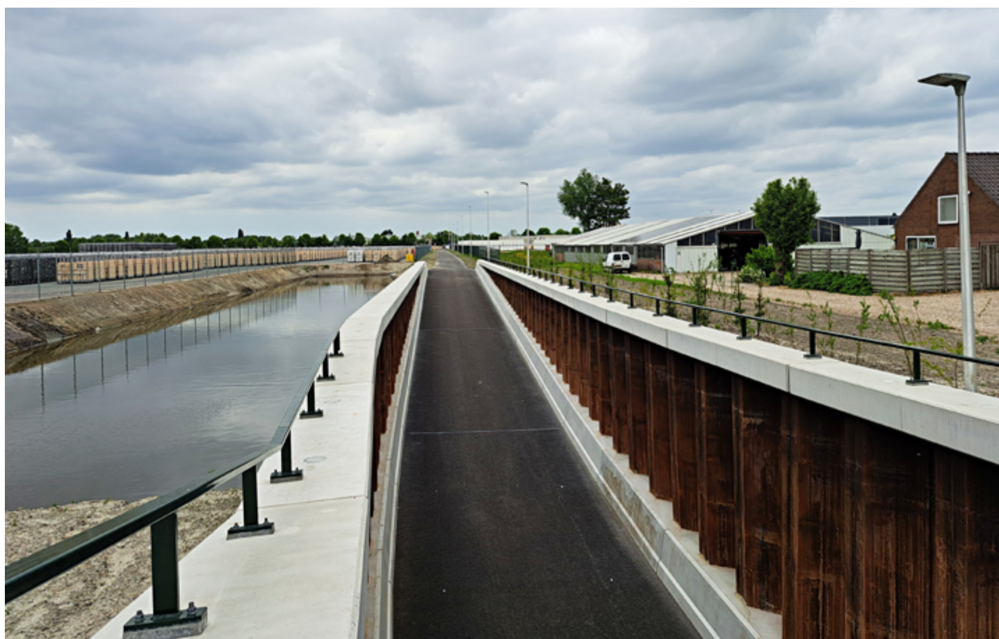
De OLV verbinding richting de Middenweg. Links het karren terrein van Royal Flora Holland.